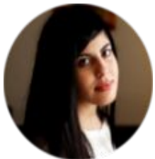
Stefania Gambella Fotografia/Piano marketing